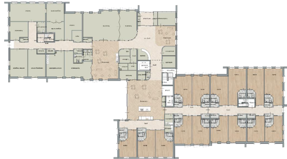
Workshop De Hokseberg