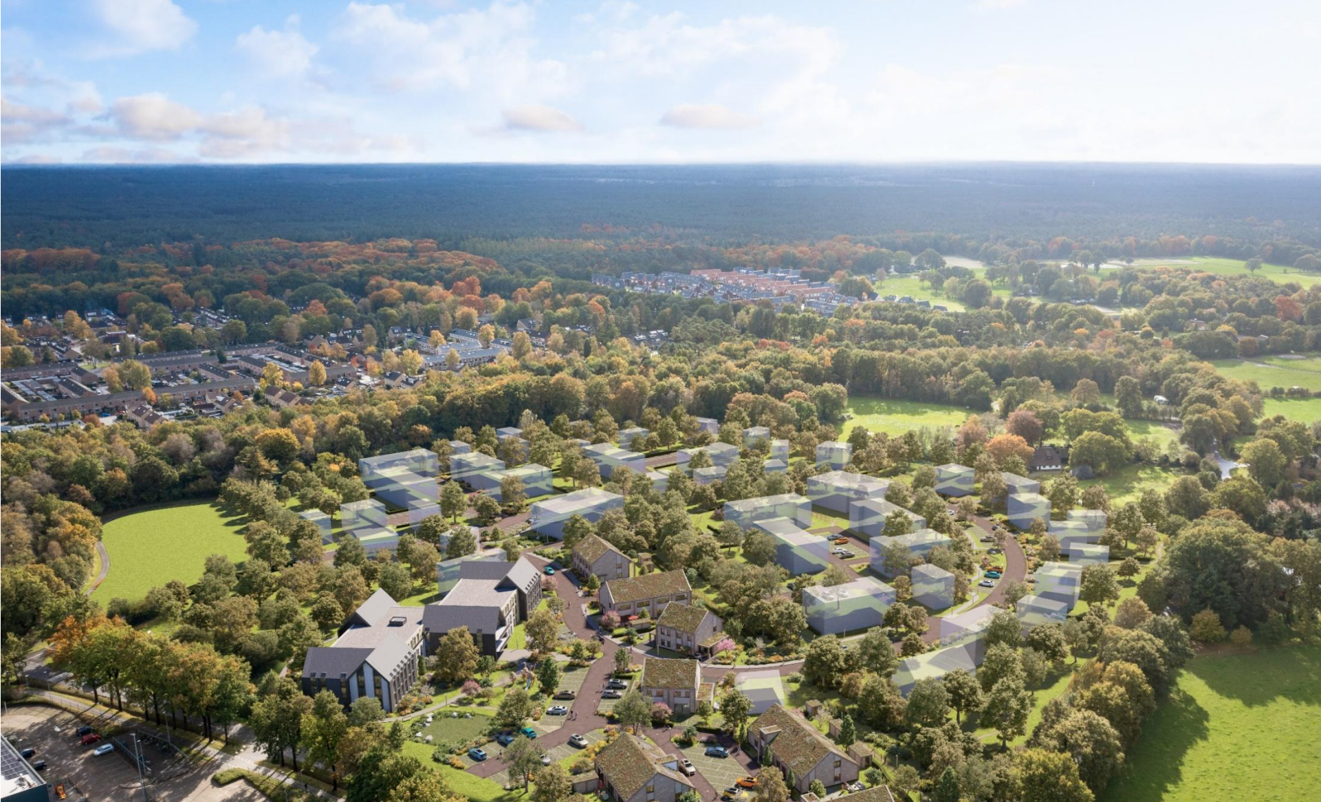
Wonen op de Hokseberg